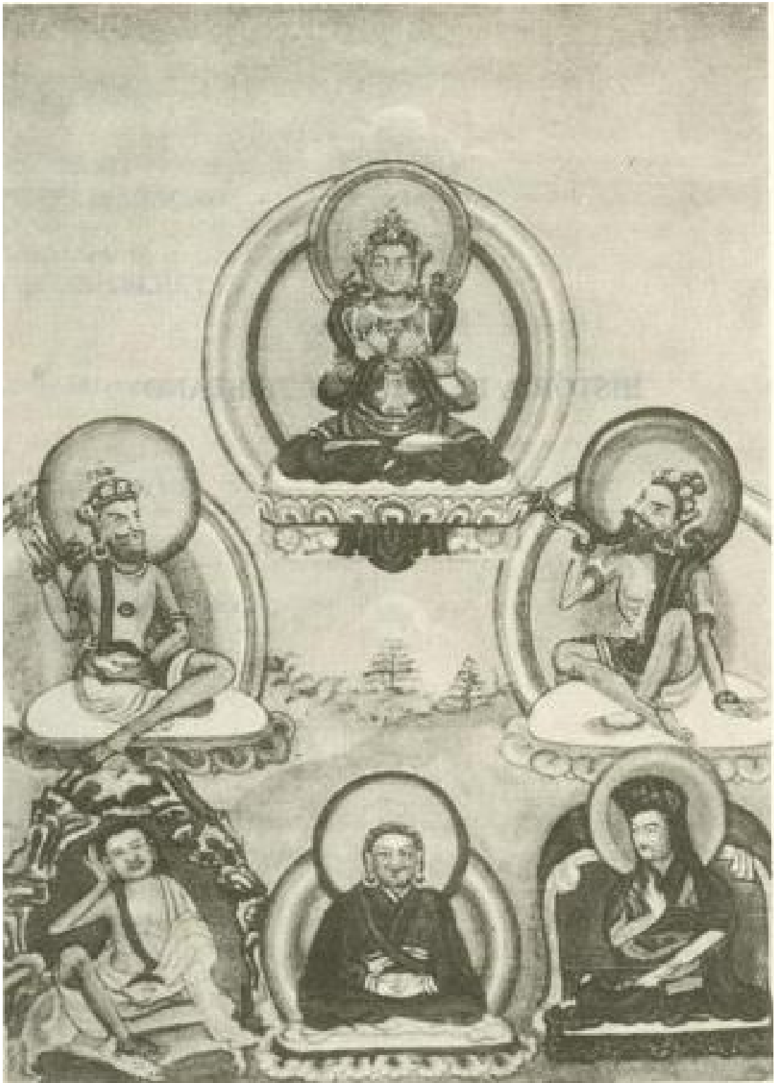
LOS GRANDES GURUS KARGYUTPAS Descritos en páginas 330-334.