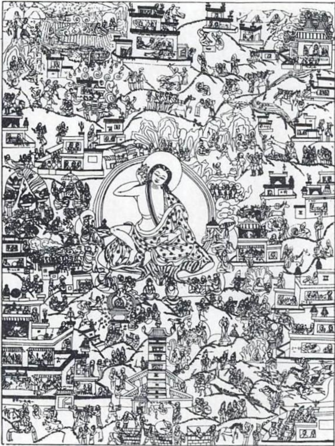
MILAREPA, EL YOGI TIBETANO Descrito en página 333.