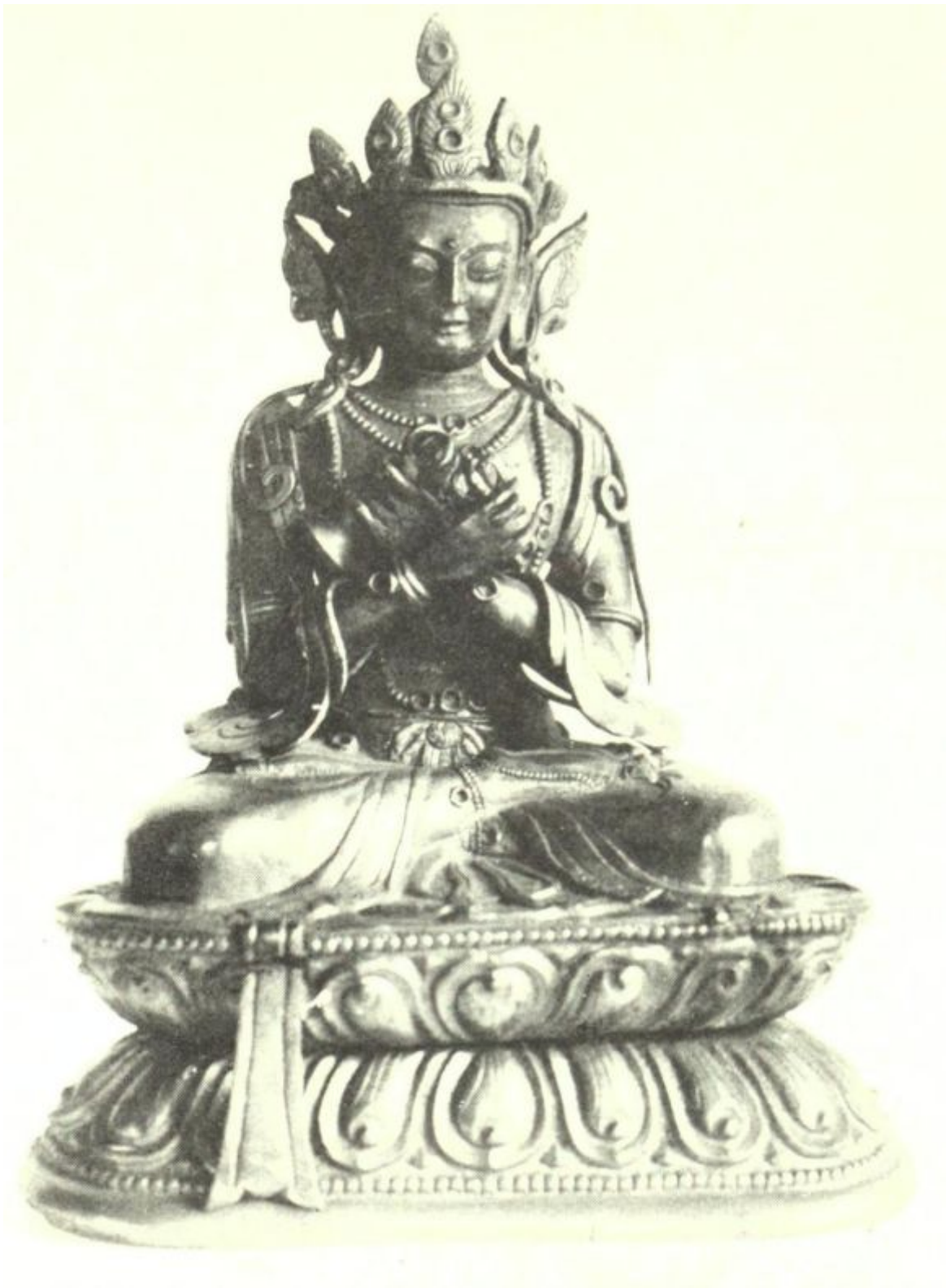
EL GURU SUPREMO. EL ADI-BUDA VAJRA-DHARA Descrito en Pág. 334 y 31-32.