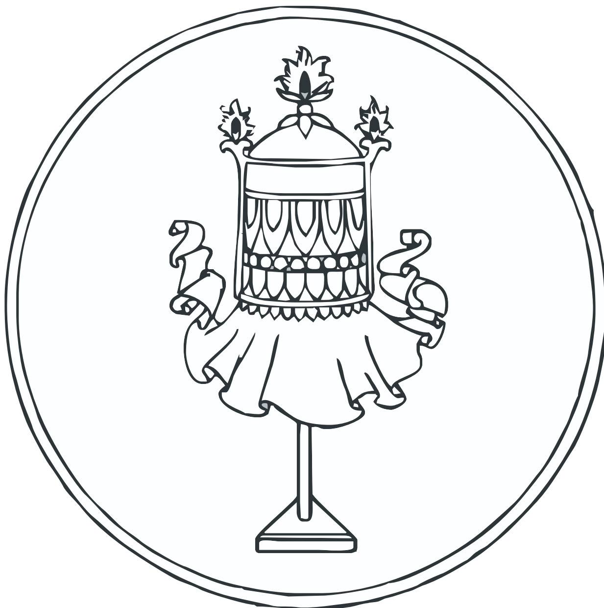
LA BANDERA DE LA VICTORIA Descriptas en páginas 57 6 , 112-113 y 279.