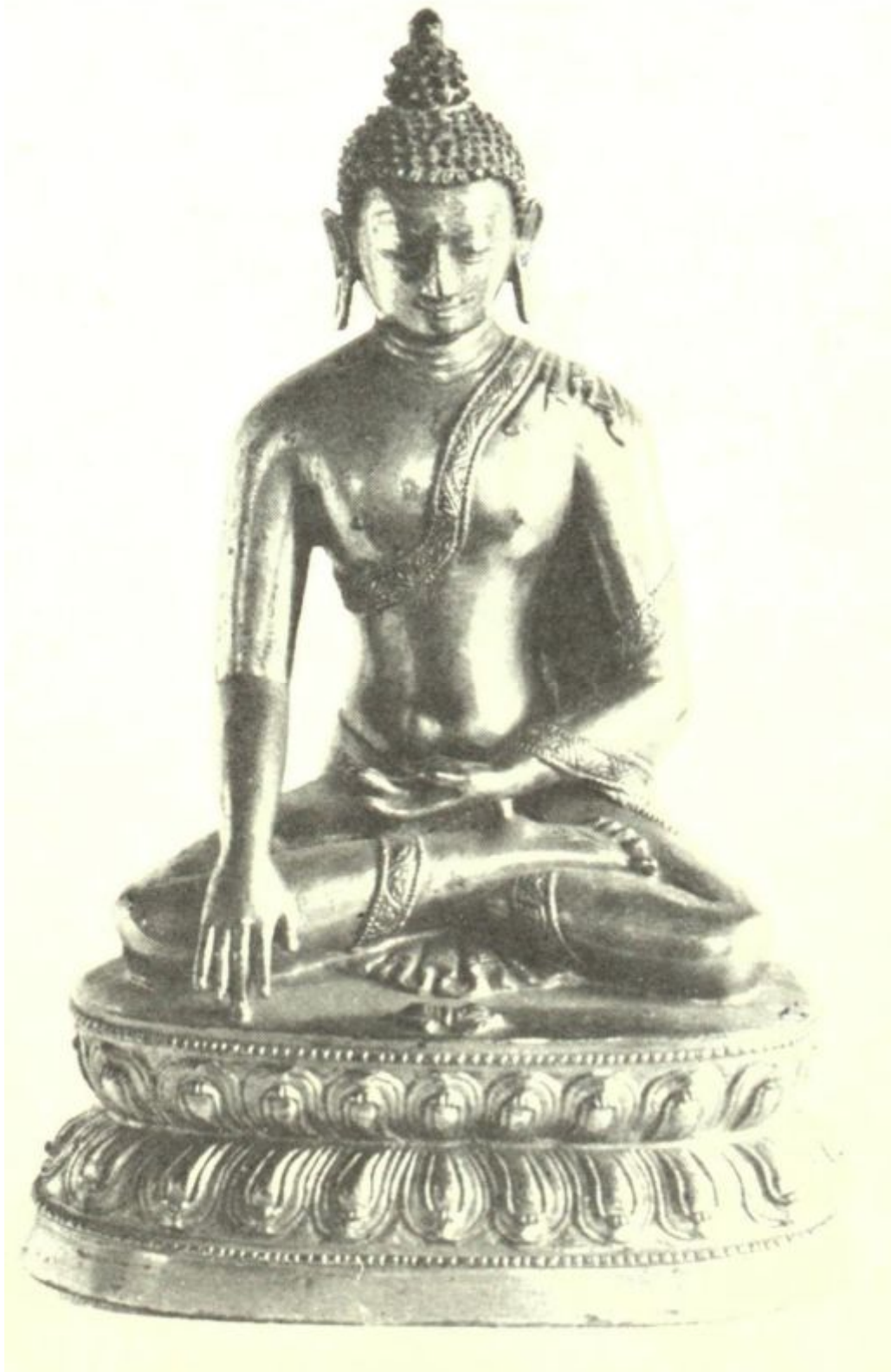
EL DHYANI BUDA AKSOBHYA Descrito en páginas 333-4.